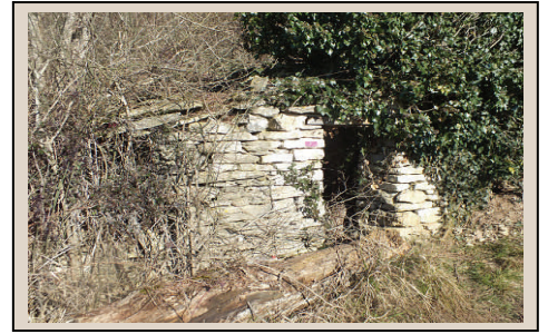
Cabotte Bouillardin à Chaux