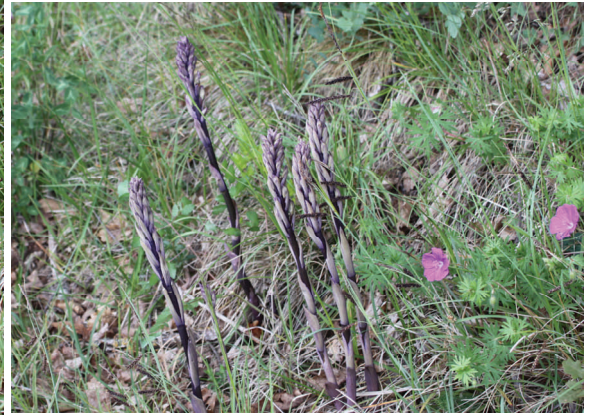
Limidore à feuilles avortées

Un livret sur la flore est en préparation afin de répertorier la flore présente sur la commune, en particulier, les orchidées très nombreuses. Il pourrait faire l'objet d'une présentation aux habitants de Chaux afin d'éveiller la curiosité de tous .