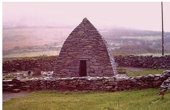
Clochans en Irlande

(Irlande), hiska (Slovénie), pineta (Sardaigne), tazota (Maroc), mitato (Crète).