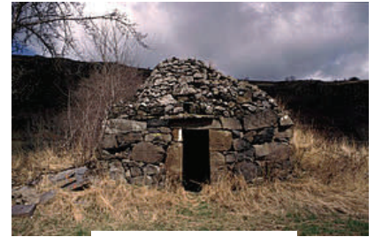
Chibotte à Vals près le Puy (Haute Loire)