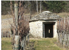
La cabotte Bonnaire à Chaux

de Nuits-Saint-Georges, une cabotte circulaire forme le cœur du bâtiment construit en 2001. A Nuits-Saint-Georges, une cabotte a été édifée sur le rond-point de l'Europe lors de la Saint Vincent de 2007.