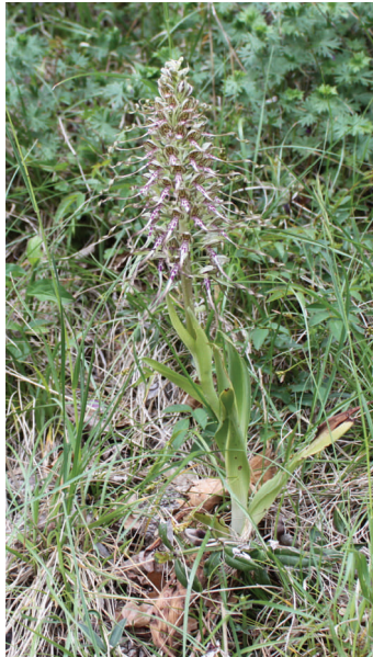
Orchis « bouc »

Un livret sur la flore est en préparation afin de répertorier la flore présente sur la commune, en particulier, les orchidées très nombreuses. Il pourrait faire l'objet d'une présentation aux habitants de Chaux afin d'éveiller la curiosité de tous .