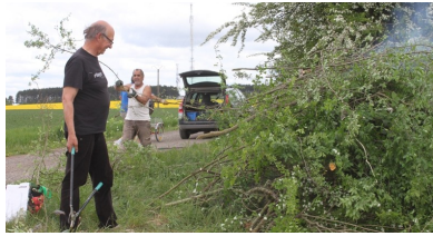
Élagage du site du calvaire du « Buisson Poiret »

Le calvaire de la croix buisson Poiret fut édifié en 1772 par Simon Domino en mémoire de son épouse Jeanne décédée en 1766. Le site a été nettoyé ainsi que le socle. Une croix en marbre a été installée. La réalisation d'une croix plus conforme à ce monument est à l'étude. Un banc sera installé à la fin de l'été et un panneau fournira aux promeneurs l'historique de la croix.