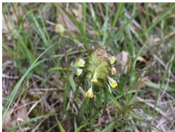
Mélampyre à crête

Une présentation illustrée à partir de leurs nombreux clichés est en cours d'élaboration.